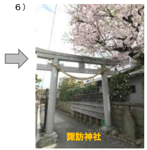
6) しばらくすると 諏訪神社の鳥居が 左手に見える