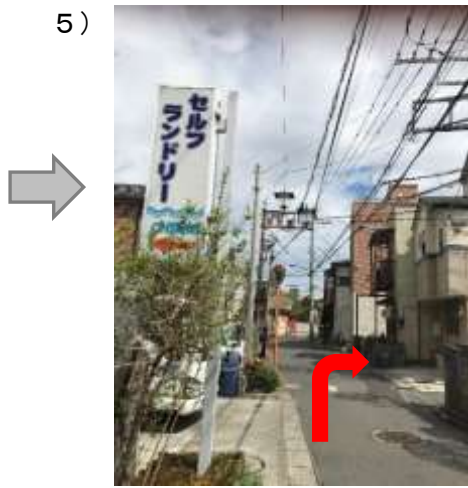
5) 左手にある「セルフコインランドリー」 を過ぎてすぐ右折