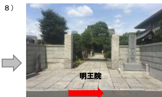
8) 左手に明王院（寺院） があり、明王院を左 手に直進