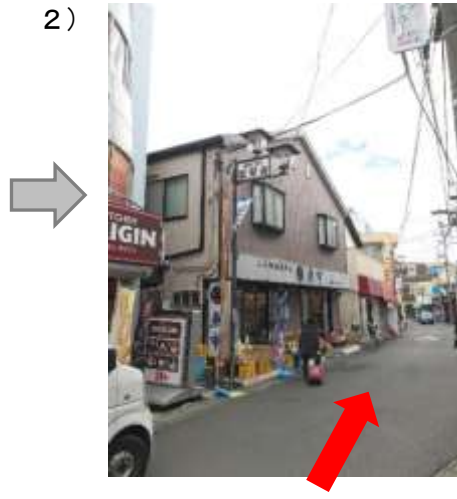
2) 商店街の中を直進