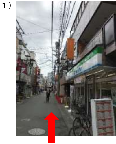
1) 二子新地駅東口改札を出て右折