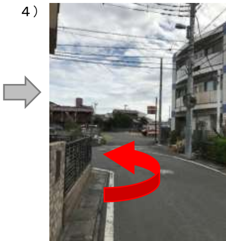
4) 道が左に曲がっているの 道なりに左折