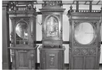
アンティークオルゴール