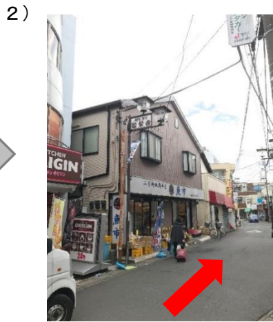
2) 商店街の中を直進 左側にオリジン弁当・魚市