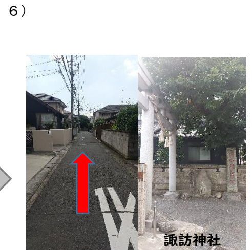
6) 右折後、直進 左側に諏訪神社の鳥居あり