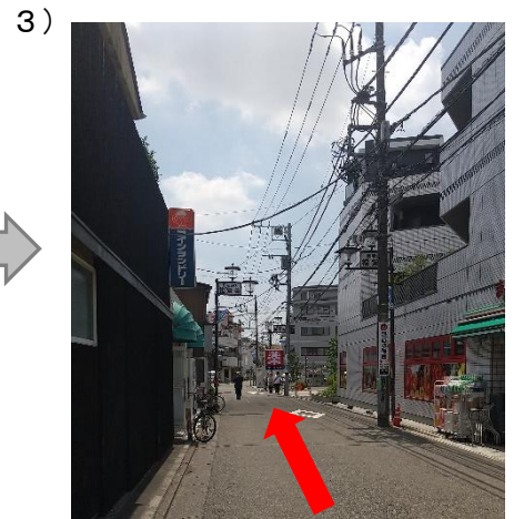
3) 道なりに直進 右側にまいばすけっと