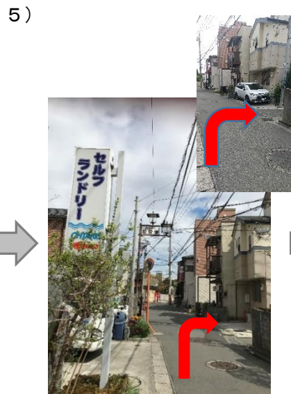
5) 左折後、直進 ここより先は住宅街 左側に「セルフコインランドリー」 を過ぎ、すぐ右折