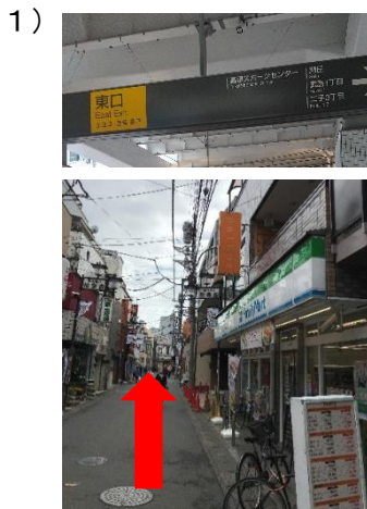
1) 東口改札を出て右折 そのまま直進